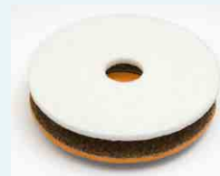
Treibteller (Mitnehmer) mit INSTA-LOK-Belag für verschiedene Pad-Scheiben + Schleifgitter