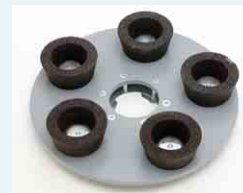
Schleifteller mit 5 Schleiftöpfen Korn 16: Abschleifen von Estrich und Beton