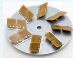
Ausfugteller Ø 450 mm für Zement

Technische Änderungen vorbehalten. Printed in Germany