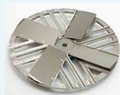
Glätteteller Ø 600 mm mit 4 Glättflügeln edelstahlgehärtet oder 48 Stahl- bzw. Kunststoffklingen: für Glatt- oder Kunstharzestriche