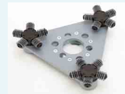
Frästeller mit Vollhartmetall-Fräsrädchen WCT spitz entfernt hartnäckige Reste von Spachtelmasse oder Kleber etc.