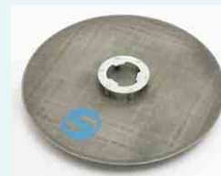
Stahlglättescheibe Ø 600 mm: Verdichten, Glätten, Planieren von Estrich, Beton etc.