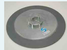
Kunststoffglättescheibe Ø 600 mm zum Scheiben und Verdichten von Epoxidharz-Estrichen und hell gefärbten mineralischen Estrichen