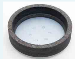
Schleifring Korn 16: Abschleifen von rauen Estrich- und Betonflächen