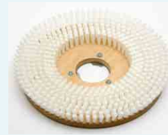
Verschiedene Bürsten für div. Anforderungen: Reinigen, Wachsen, Bohnern, etc.