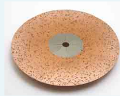
Schleifscheibe mit Hartmetallsplitt Korn 14 (offen) belegt: Schleifen von Anhydritböden