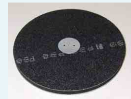
Schleifteller mit flexibler Unterlage für Papier doppelseitig und Hartmetallschleifscheibe