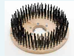
Bürste Stahlflachdraht (ölgelärtet): Reinigen von Betonböden und Pflastersteinen, Einbürsten von Haftbrücken